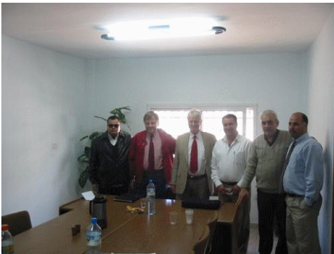
اجتماع مع غرفة تجارة بيت لحم - 8 نيسان

سينظم المشروع عدة تدريبات وورش عمل لهيئة وأعضاء مجلس الشاحنين الفلسطيني حول أمور يعينها الأعضاء. وفي هذا السياق، تم عقد الورشات التالية بالتعاون مع خبراء من مؤتمر الأمم المتحدة للتجارة والتنمية: