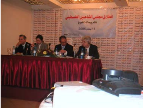
انطلاق مجلس الشاحنين الفلسطيني في فندق جراند بارك - 11 نيسان