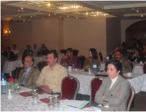
انطلاق مجلس الشاحنين الفلسطيني في فندق جراند بارك - 11 نيسان