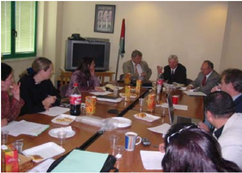
اجتماع الهيئة التأسيسية وخبراء UNCTAD - 10 نيسان