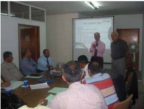
ورشة عمل في بيت لحم، 14 أيلول 2006