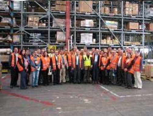
ورشة عمل وزيارة إلى المامان في تل أبيب، 6-7 كانون أول 2006