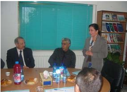
ورشة عمل بالتعاون مع جمعية رجال الأعمال، 14 تشرين الثاني 2006