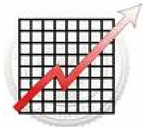
مشاكل التجار الرئيسية

الشكل رقم 1 على سبيل المثال يظهر بعض الإحصائيات عن المشاكل الرئيسية للتجار. فمثل هذه النتائج وغيرها يتم التعامل معها بعد ذلك بطرق مختلفة من أجل الوصول إلى حلول عملية كما تستخدم كمرجع رئيسي لأجندة ورشات العمل اللاحقة.