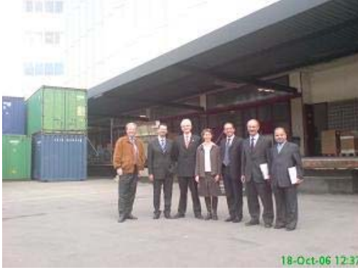
الرحلة العالمية الدراسية الأولى في بلجيكا وجنيف ، 12-19 تشرين أول 2006