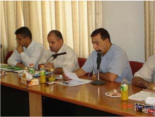
ورشة عمل في غزة، 14 أيلول 2006