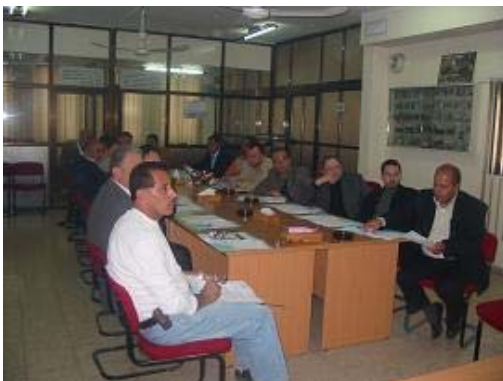
ورشة عمل في قلقيلية، 11 كانون الأول 2006

7) مقابلة السلطات الإسرائيلية في معبر إيرز: عقد المجلس اجتماعاً مع المسؤولين الإسرائيليين في معبر إيرز وذلك من أجل تسهيل حركة أعضاء مجلس الشاحنين الفلسطينيين.