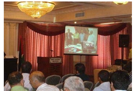
اجتماع الجمعية العامة 25 حزيران 2007